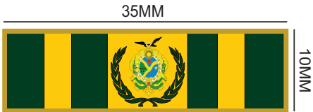
ANEXO III Medalha e Barreta da Secretaria de Estado de Segurança Pública do Amazonas