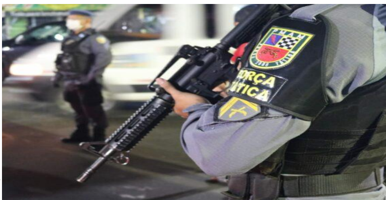
Figura 1 – Título da ilustração.